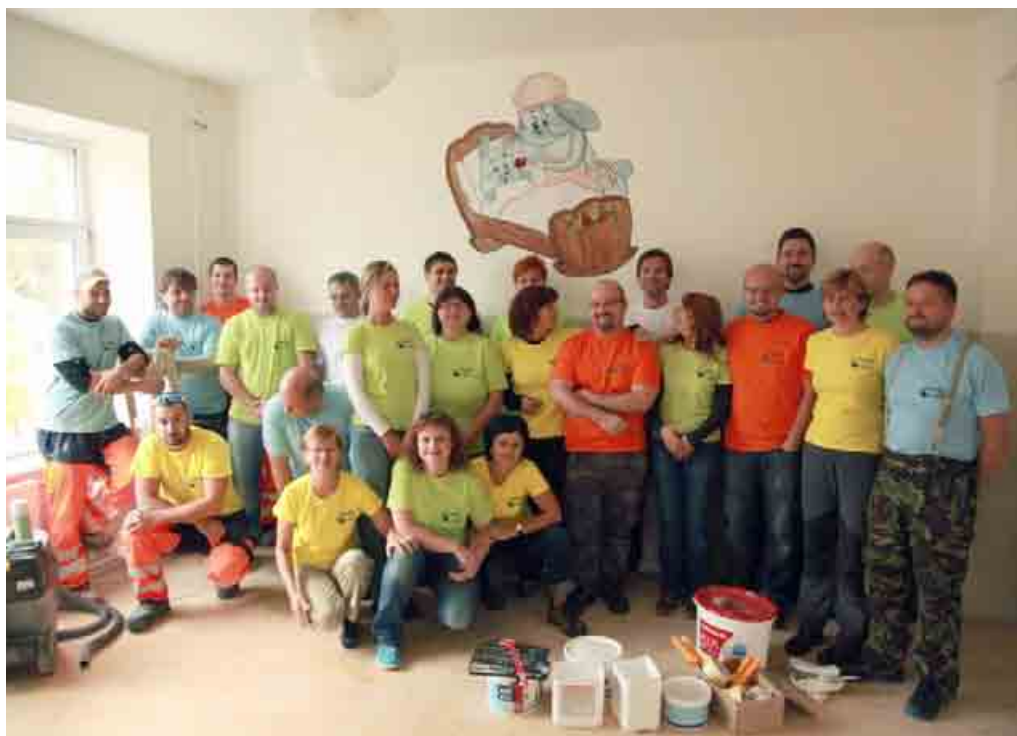
Tím zamestnancov Skanska SK v Martine upravil aj interiér Detského domova.