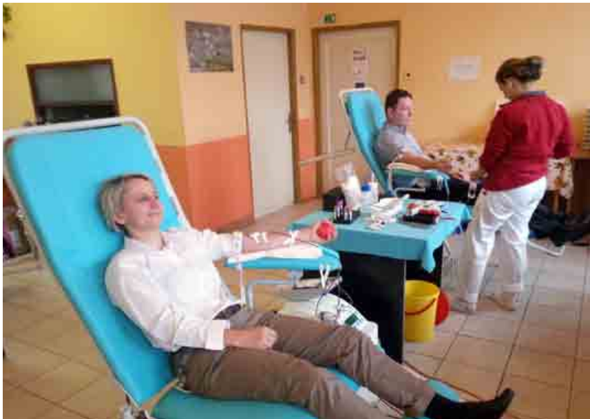
Skupina darcov v spoločnosti SSE sa neustále zväčšuje, čo znamená aj väčšiu možnosť záchrany života pacientov, ktorí sú často na darcovstvo odkázaní.

Zamestnanci Stredoslovenskej energetiky (SSE) mali 22. septembra opäť príležitosť bezplatne darovať krv. Z celej skupiny SSE prišlo 32 zamestnancov, ktorí spolu darovali takmer 14,5 litra najcennejšej a nenahraditeľnej tekutiny.