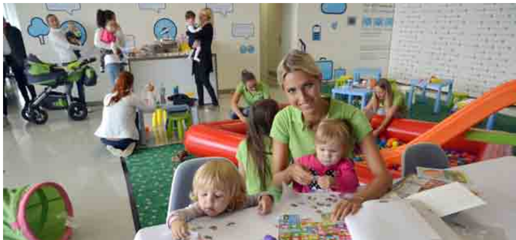
Počas stretnutia sa deti zamestnancov Volkswagen Slovakia zahrali v na tento účel vytvorenom detskom kútiku.

Volkswagen Slovakia sa v septembri prvýkrát stretol s rodičmi – zamestnancami firmy, ktorí sú v súčasnosti na materskej alebo rodičovskej dovolenke. Dozvedeli sa, ako udržiavať kontakt so spoločnosťou, napríklad prostredníctvom Newslettera, o možnosti využívať niektoré sociálne benefity a tiež služby v zdravotnom stredisku firmy. Témami stretnutia boli aj bilingválne vzdelávanie detí, perspektívny e-learnig, či možnosti flexibilného pracovného času formou skráteného pracovného úväzku alebo, pri niektorých pracovných pozíciách, formou práce z domu. «